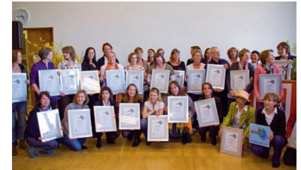
2010 wurden die ersten 35 Einrichtungen ausgezeichnet.

Kindertageseinrichtungen, die Bildung für nachhaltige Entwicklung erfolgreich umgesetzt haben, werden für dieses Engagement als „KITA21“ ausgezeichnet. Über die Auszeichnung entscheidet eine unabhängige Jury. Im Rahmen einer feierlichen Veranstaltung erhalten die Einrichtungen eine Urkunde und eine KITA21-Plakette für den Eingangsbereich.