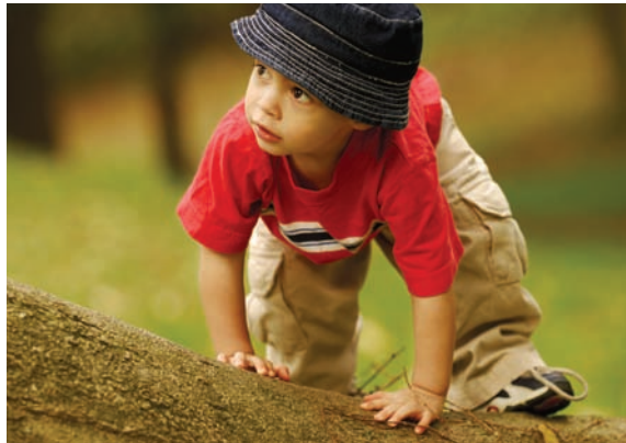
KITA21-Projekte fördern die Entdeckungslust von Kindern.

Kinder sind neugierig, wissensdurstig und begeisterungsfähig. Spielerisch und mit allen Sinnen erkunden sie ihre Umwelt und beginnen bereits sehr frühzeitig sich ein Bild von der Welt zu machen. In den ersten Lebensjahren entwickeln sie Wertvorstellungen und Haltungen, die ihr zukünftiges Handeln beeinflussen. Deshalb kommt der Bildungsarbeit in Kindertageseinrichtungen (Kitas) eine große Bedeutung zu.