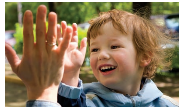
Gemeinsam handeln für die Zukunft.

Schlüsselthemen von Bildung für nachhaltige Entwicklung sind Wasser, Energie und Klimaschutz, Ernährung oder Ökologie. All diese Themen lassen sich hervorragend mit kitarelevanten Bildungsinhalten wie Naturwissenschaften, Sprachförderung, Gesundheitserziehung oder Weiterbildung verbinden – von der Krippe bis zum Hort. KITA21-Projekte liefern Inhalte, die für Kinder und Erwachsene gleichermaßen spannend sind!