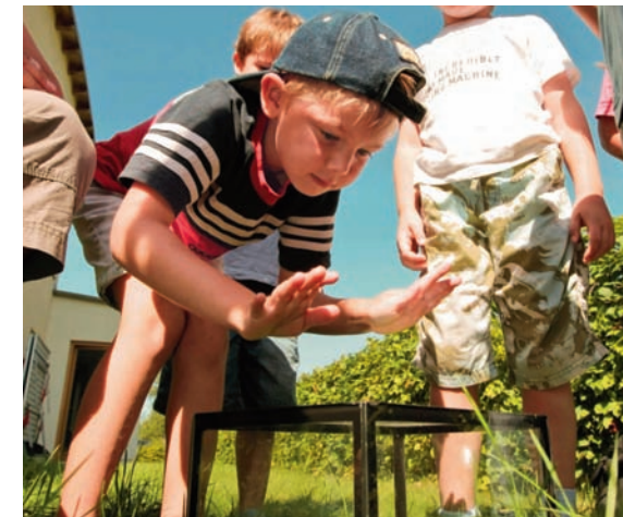
Was ist der Treibhauseffekt und was hat er mit dem Klimawandel zu tun?

Die Initiative KITA21 unterstützt Erzieherinnen und Erzieher bei der Gestaltung lebendiger Bildungsangebote, die sich an dem Leitbild einer nachhaltigen Entwicklung orientieren, und zeichnet sie für dieses Engagement aus.